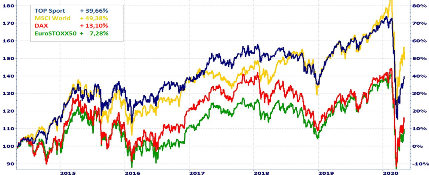
Commerzbank Top Sport Index TOP Sport Global Equity / n/a vom 01.05.2014 bis 01.05.2020 6 Jahre

Kumulierte Performance TOP Sport-Zertifikat + TOP Sport Global Equity seit dem 01.05.2014: + 39,66%