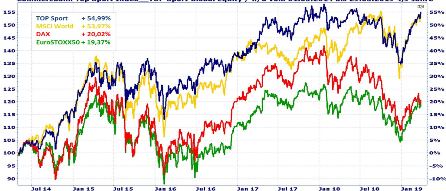
Commerzbank Top Sport Index TOP Sport Global Equity / n/a vom 01.05.2014 bis 29.03.2019 4,9 Jahre

Kumulierte Performance TOP Sport-Zertifikat + TOP Sport Global Equity seit dem 01.05.2014: + 54,99%